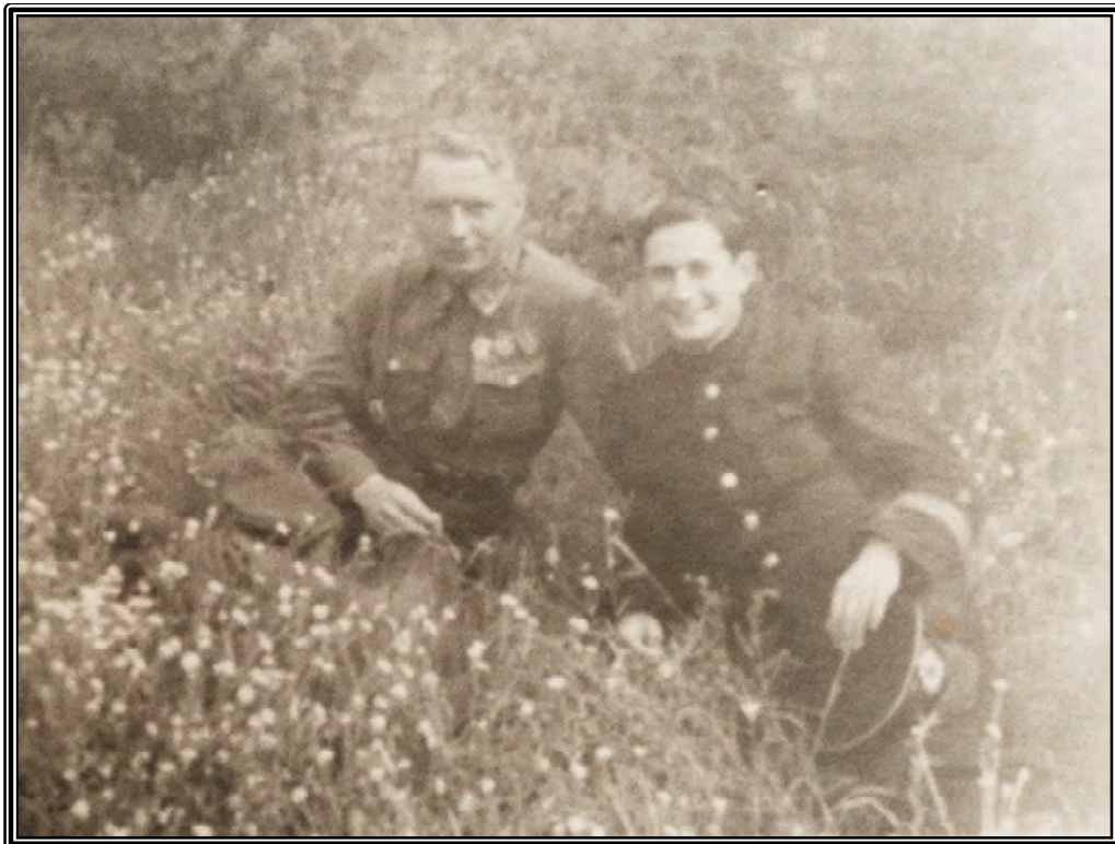
( на фото слева)

Капитан Соловьёв был ранен, мотор его «Чайки» повреждён, но лётчик сумел долететь до места дислокации авиаполка, и безупречно посадил самолёт.