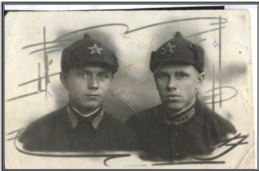
(на фото слева)