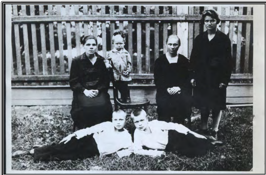
(фото из семейного архива)

Константин Владимирович Соловьёв родился 15 мая 1914 года в посёлке Городищи, в то время Орехово-Зуевского района Московской области.